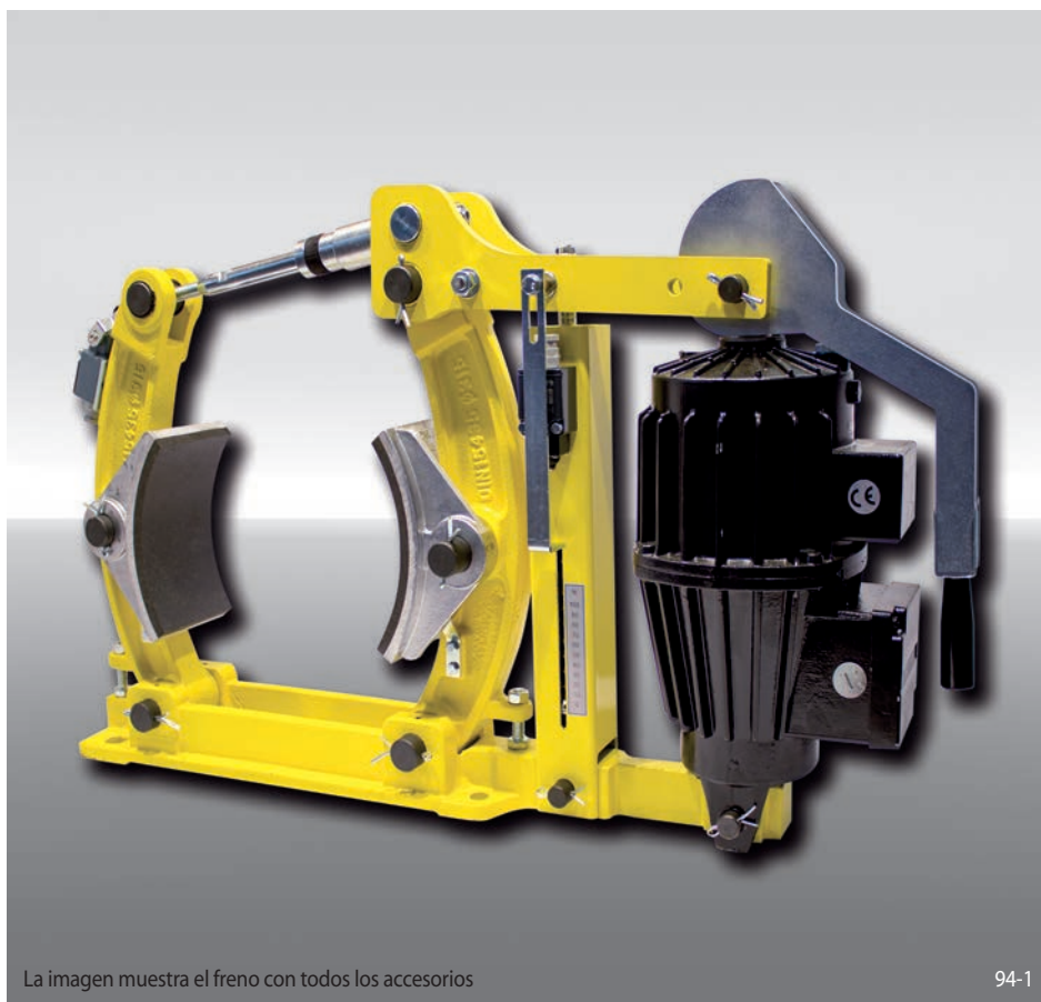
La imagen muestra el freno con todos los accesorios